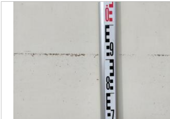
Trace sur le portail