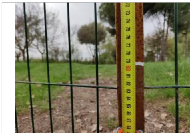
Trace sur le portail