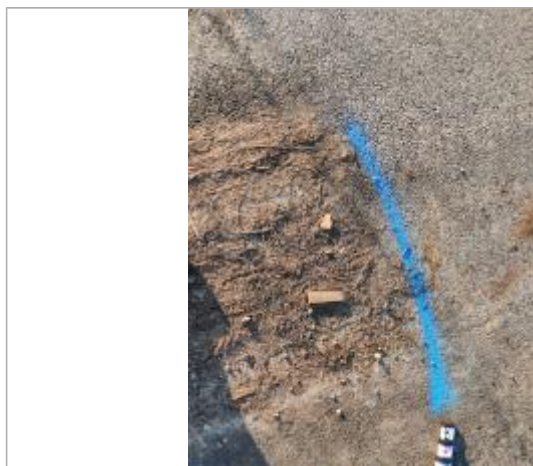
Dépôt sur la chaussée