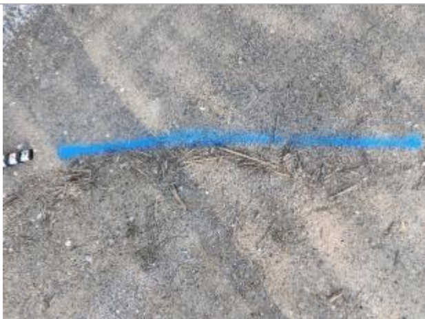
Dépôt sur le chemin

Altitude calculée de l'eau (en m) : 2.4 m