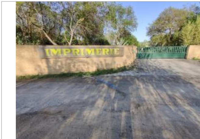
Chemin de vigne salade

Coordonnées WGS84 : X: 3.28465920 / Y: 43.27014540