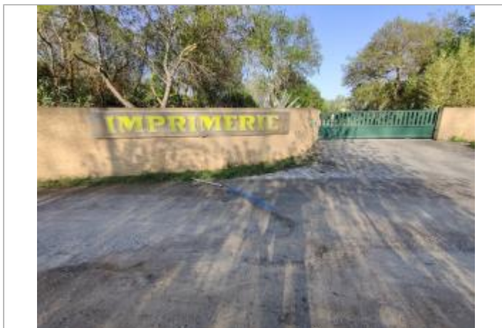
Chemin de vigne salade