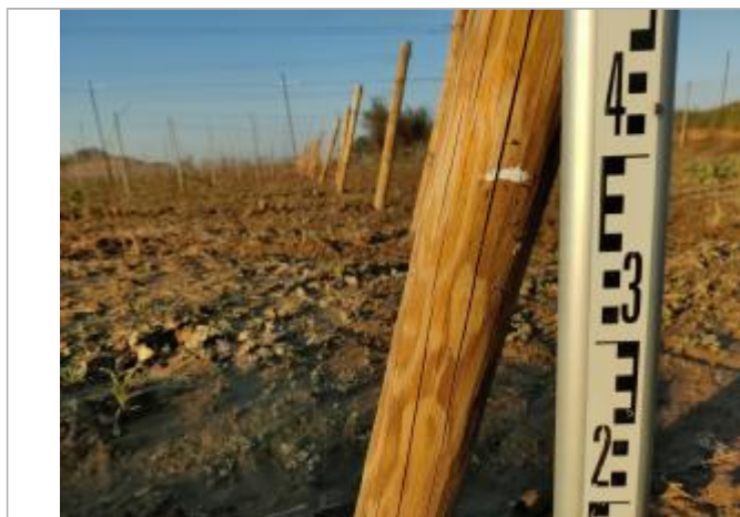
Trace sur le piquet de tête

Altitude calculée de l'eau (en m) : 2.38 m