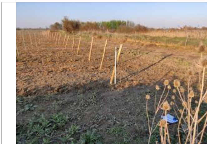
Piquet de vigne