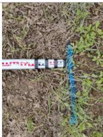
Dépôt au sol