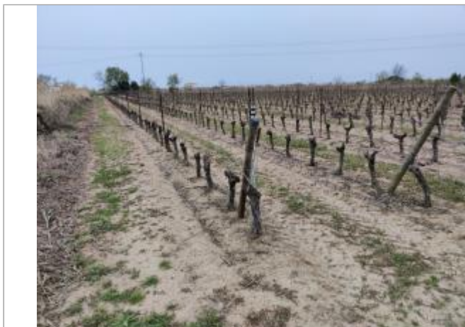
Piquet de tête

Coordonnées WGS84 : X: 3.33176930 / Y: 43.30029930