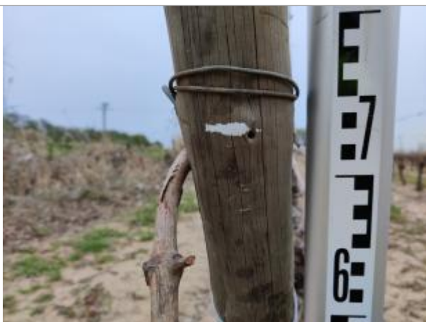
Trace sur le poteau

Altitude calculée de l'eau (en m) : 2.19 m