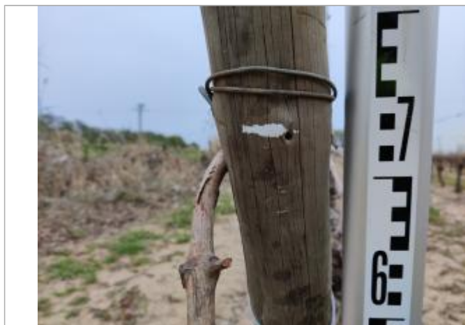
Trace sur le poteau

Altitude calculée de l'eau (en m) : 2.19 m