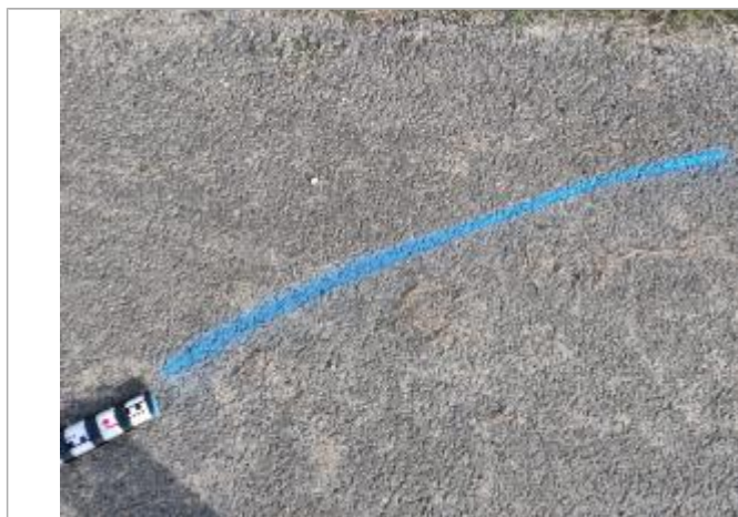
Dépôt sur la chaussée