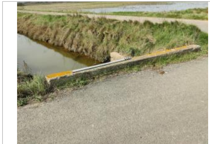
Cadre de fossé

Coordonnées WGS84 : X: 3.30242830 / Y: 43.26553640