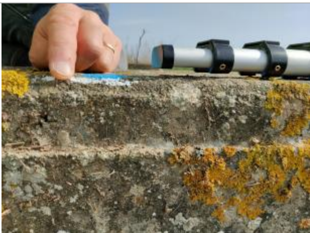
Trace sur le cadre