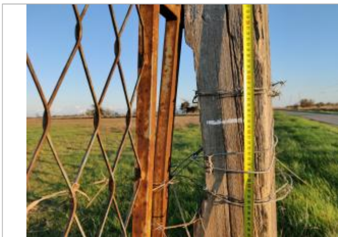
Débris végétaux dans le portail

Altitude calculée de l'eau (en m) : 2.071 m