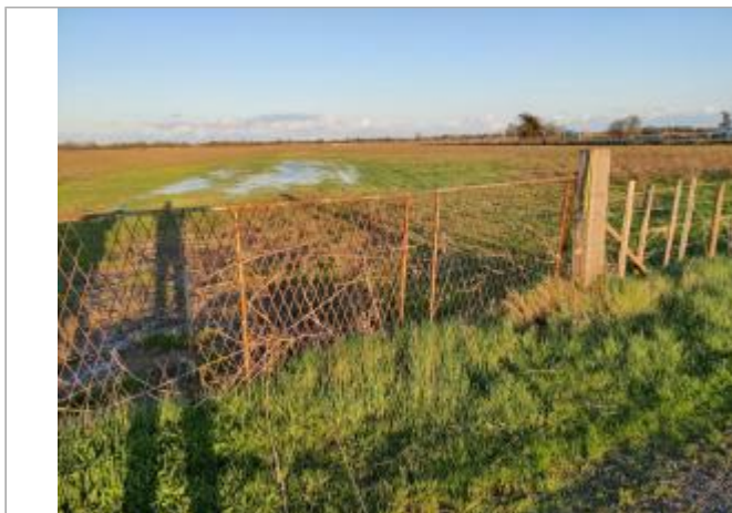
Poteau du portail