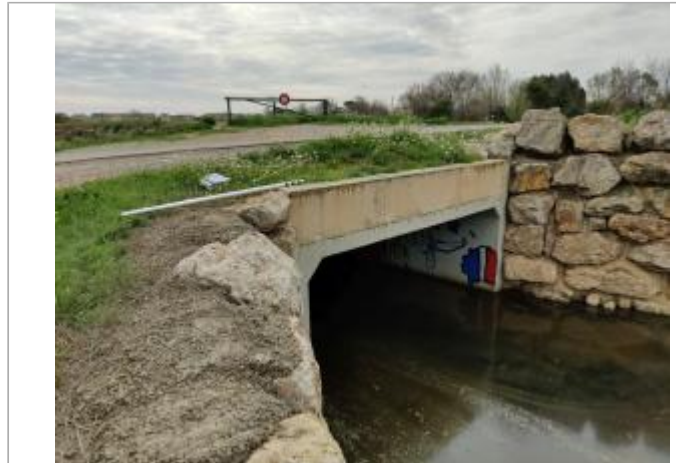
Mur du dalot

Coordonnées WGS84 : X: 3.29335540 / Y: 43.25904870