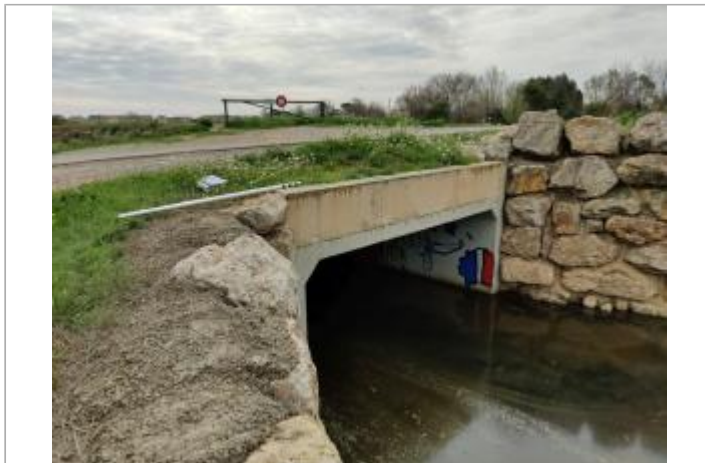
Mur du dalot