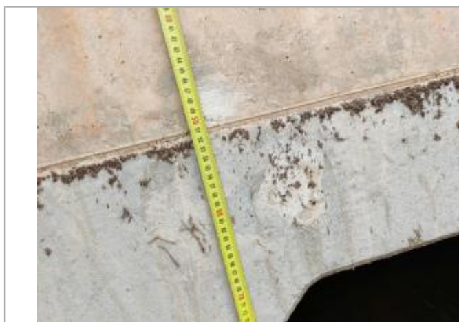
Trace sur le dalot