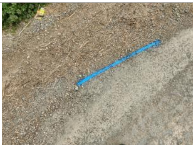
Dépôt sur la chaussée