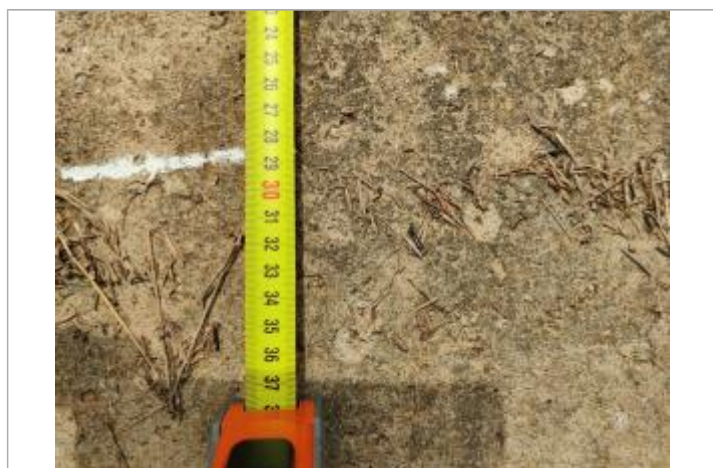
Trace sur le cadre