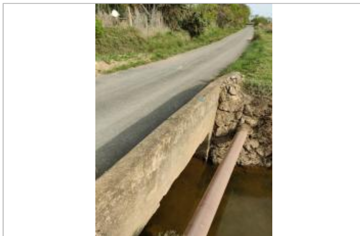
Cadre de fossé