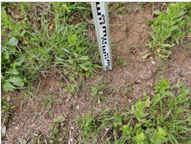
Dépôt contre la digue

Altitude calculée de l'eau (en m) : 1.908 m