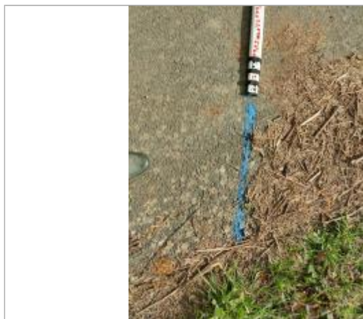
Dépôt sur la piste