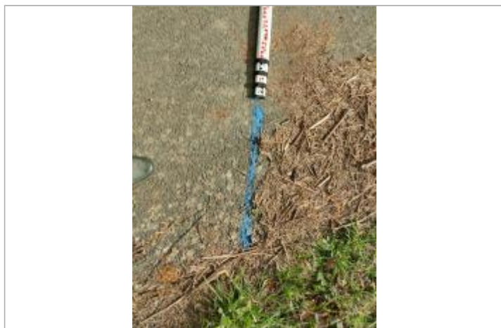
Dépôt sur la piste

Altitude calculée de l'eau (en m) : 1.91 m