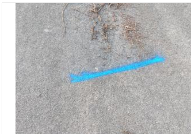
Dépôt sur la chaussée