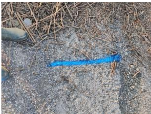
Dépôt sur la chaussée

Altitude calculée de l'eau (en m) : 1.88 m