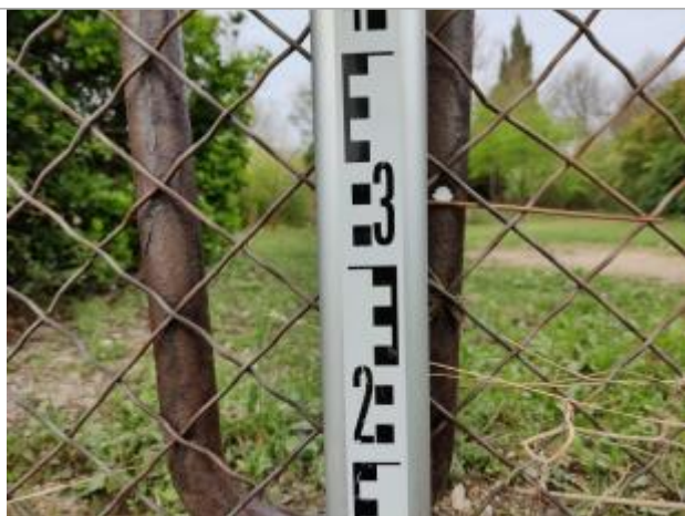
Débris végétaux dans le portail