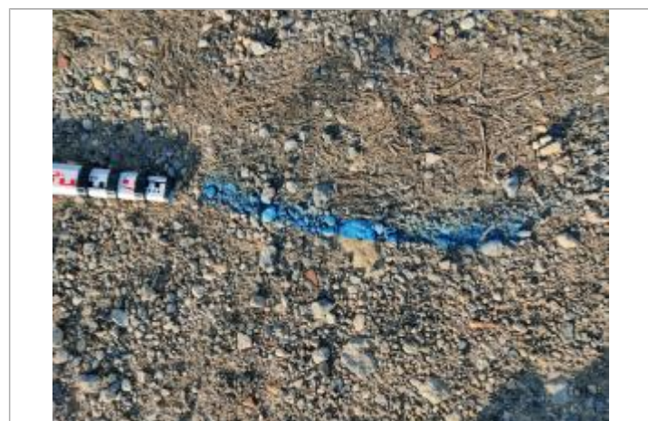
Dépôt sur le chemin