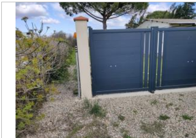
Montant de portail