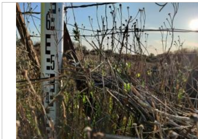
Dépôt contre le piquet