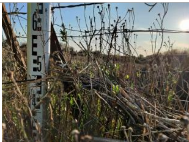
Dépôt contre le piquet

Altitude calculée de l'eau (en m) : 1.79 m