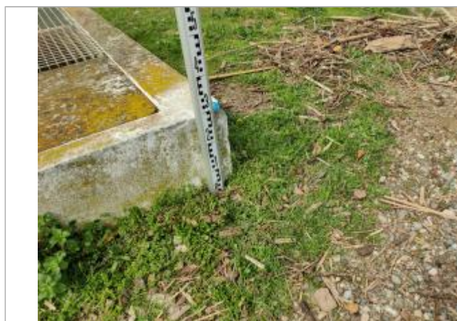
Dépôt contre le regard