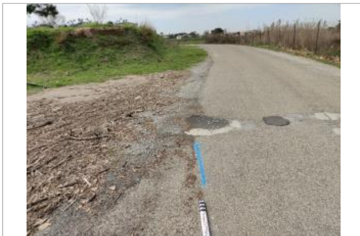
Route du port