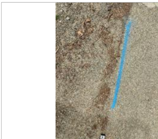
Dépôt sur la chaussée