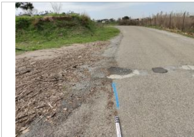
Route du port

Coordonnées WGS84 : X: 3.30154960 / Y: 43.25872930