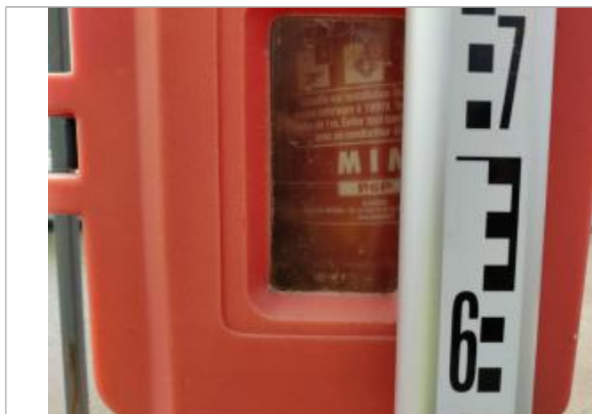
Trace sur le support

Altitude calculée de l'eau (en m) : 1.7 m