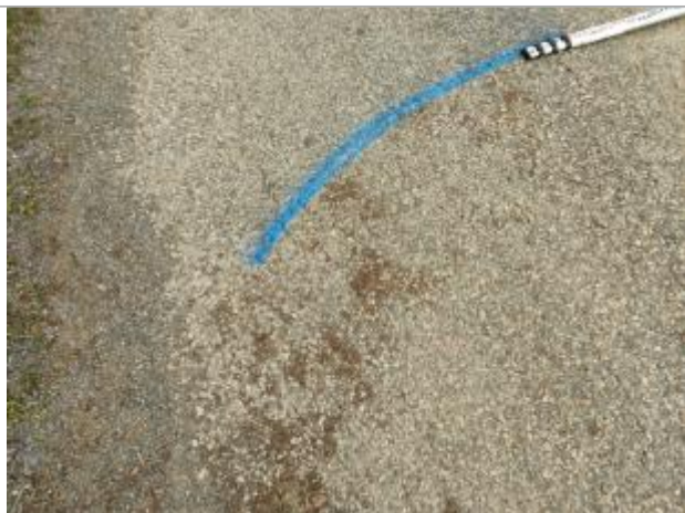
Dépôt au sol

Altitude calculée de l'eau (en m) : 1.69 m