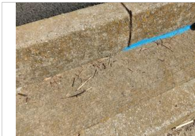
Dépôt sur la marche