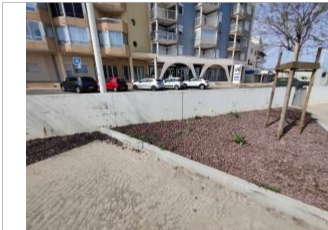
Mur d'enceinte du parking