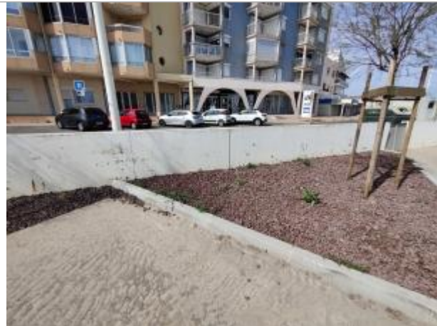
Mur d'enceinte du parking