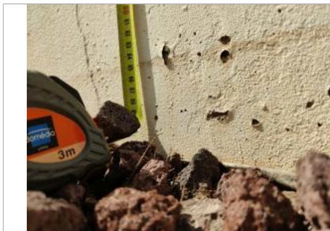
Trace sur le mur