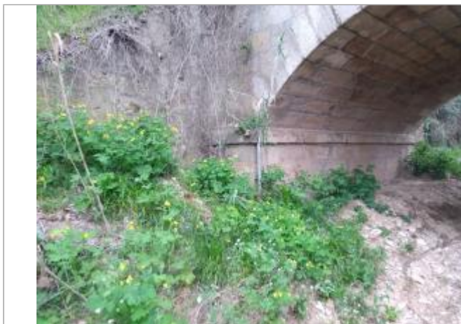
Pile de pont