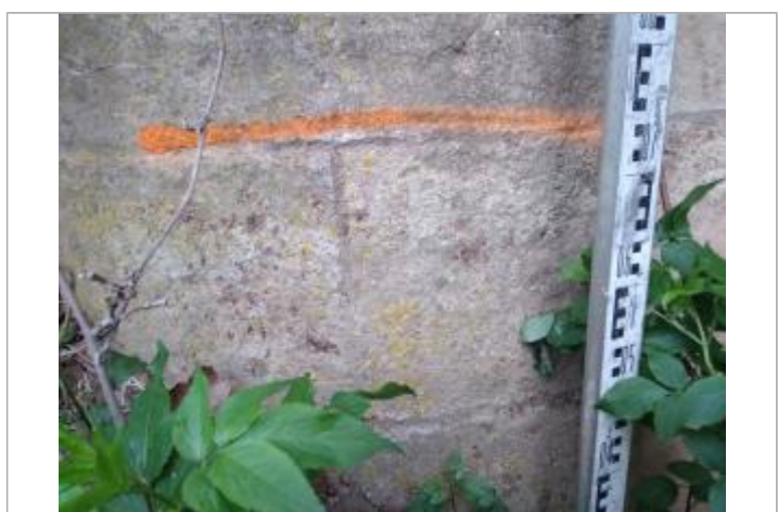
Trace sur le pile du pont

GÉNÉRAL Code : 23_ORB22_R_816_1 Date de mise à jour : 26/04/2023 Auteur : SPC MO