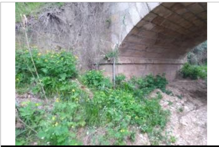
Pile de pont

GÉOLOCALISATION Coordonnées WGS84 : X: 3.03966650 / Y: 43.36231490 Coordonnées RGF93 (Lambert 93) X: 703217.1 / Y: 6251464.99 Coordonnées RGF93 (ETRS89) : X: 3.0396665 / Y: 43.3623149 Code Hydro: Y2580500 Rive de référence: Droite