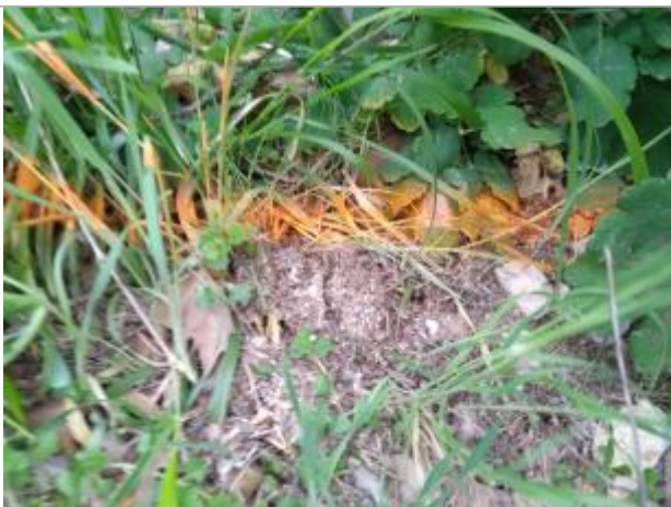
Dépôt en berge

Altitude calculée de l'eau (en m) : 64.37