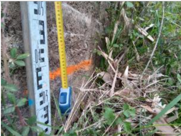
Dépôt contre le mur

Altitude calculée de l'eau (en m) : 60.027