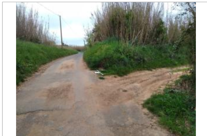
Talus en bord de chemin

GÉOLOCALISATION Coordonnées WGS84 : X: 3.05281940 / Y: 43.36024920 Coordonnées RGF93 (Lambert 93) X: 704284 / Y: 6251236 Coordonnées RGF93 (ETRS89) : X: 3.0528194 / Y: 43.3602492 Code Hydro: Y2580500 Rive de référence: Droite