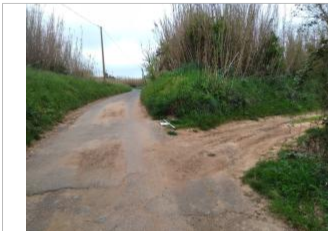
Talus en bord de chemin

Coordonnées WGS84 : X: 3.05281940 / Y: 43.36024920