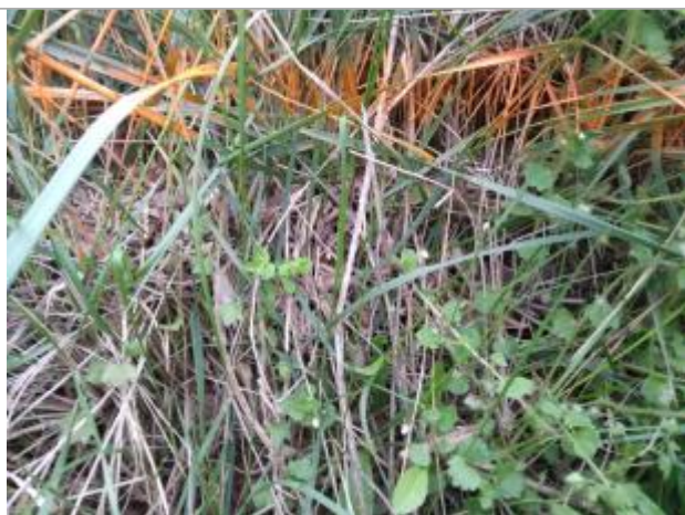
Dépôt sur le talus