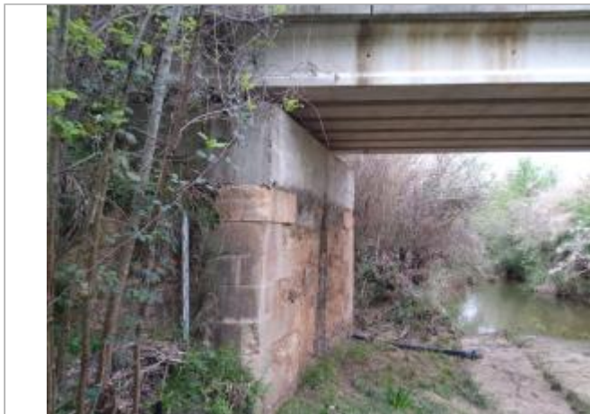
Culée du pont