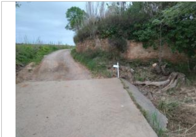
Mur de soutènement