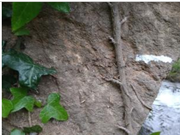
Trace sur l'arche

Altitude calculée de l'eau (en m) : 33.923