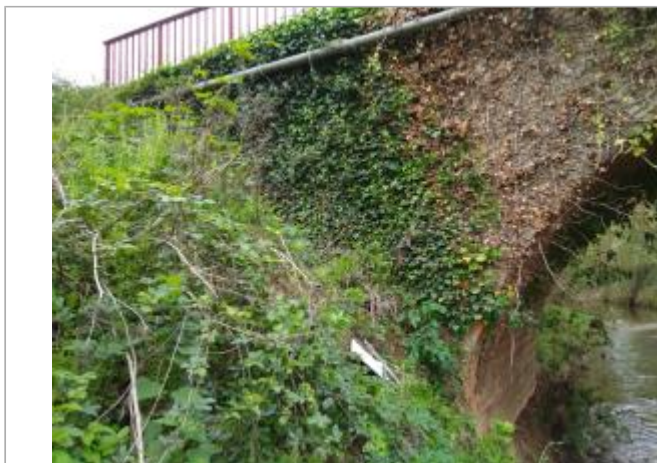
Arche du pont

Coordonnées WGS84 : X: 3.12118020 / Y: 43.36325290