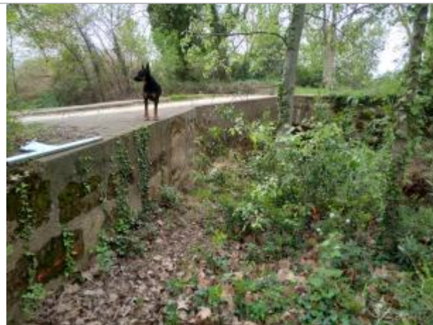
Culée du pont