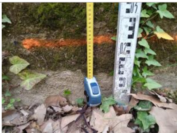
Trace sur la culée

Altitude calculée de l'eau (en m) : 27.139