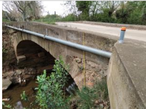
voûte du pont

Coordonnées WGS84 : X: 3.14579850 / Y: 43.35154570