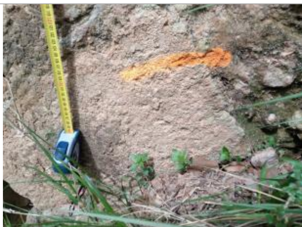
Trace sur le voûte