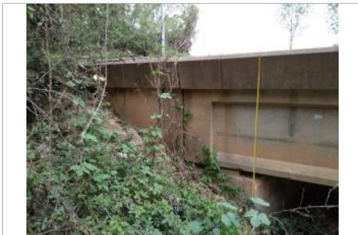
Culée du pont