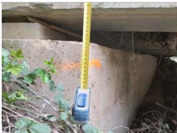
Trace sur la culée

Altitude calculée de l'eau (en m) : 20.376