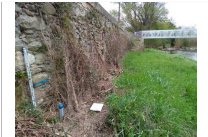
Mur de soutènement

Coordonnées WGS84 : X: 2.94927970 / Y: 43.42399800