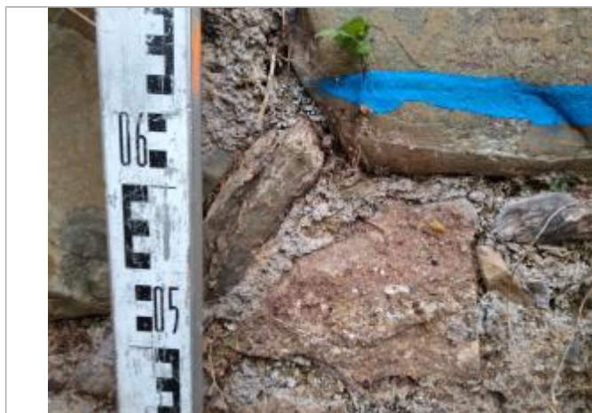
Trace sur le mur

Altitude calculée de l'eau (en m) : 112.74