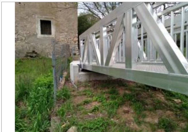
Massif béton de la passerelle