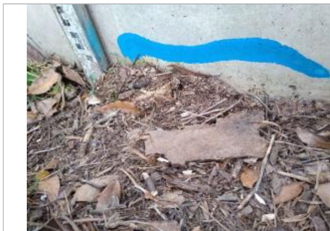
Dépôt contre le massif en béton