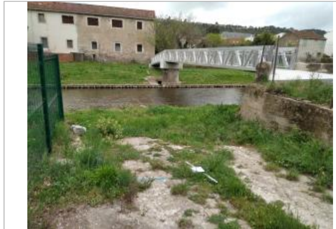
Rampe d'accès à la rivière