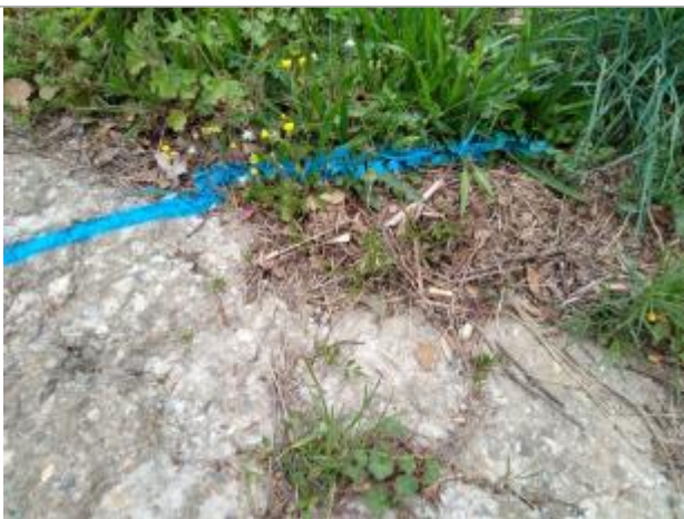
Dépôt sur la rampe