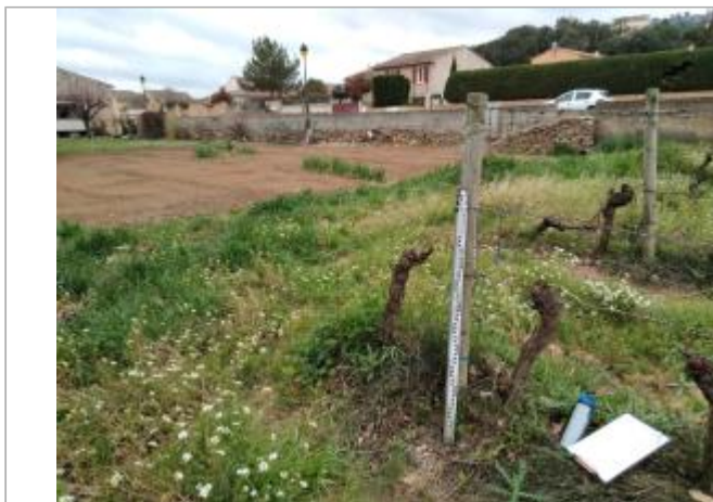
Piquet de vigne