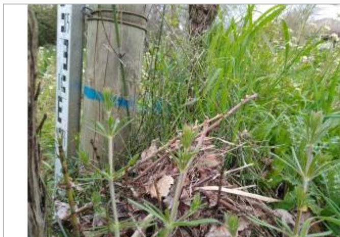
Dépôt contre le piquet