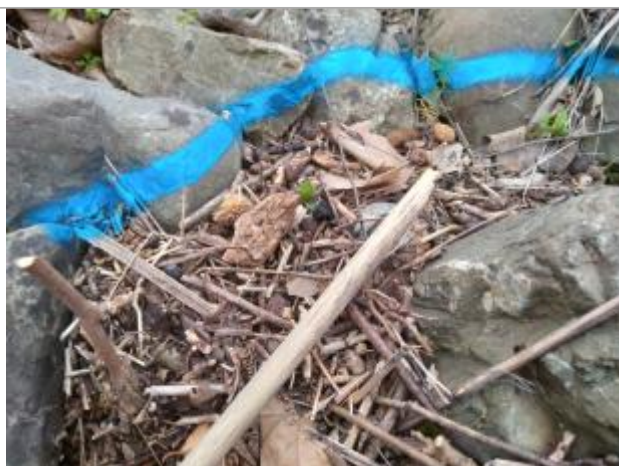
Dépôt sur les gabions

Altitude calculée de l'eau (en m) : 88.531