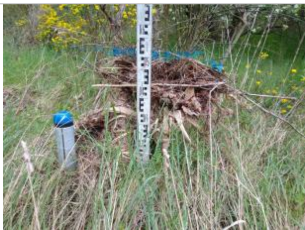
Dépôt contre le genet

Altitude calculée de l'eau (en m) : 78.01