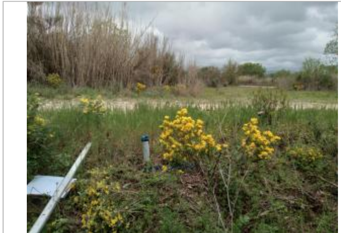
Haut de berge

Coordonnées WGS84 : X: 3.01003450 / Y: 43.44986560