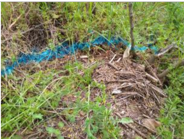
Dépôt en haut de berge