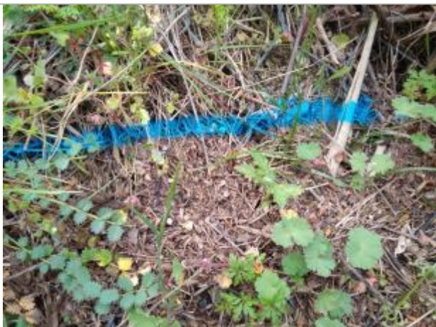
Dépôt en haut de berge

Altitude calculée de l'eau (en m) : 67.58