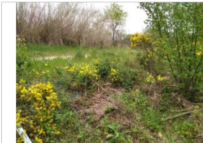
Haut de berge