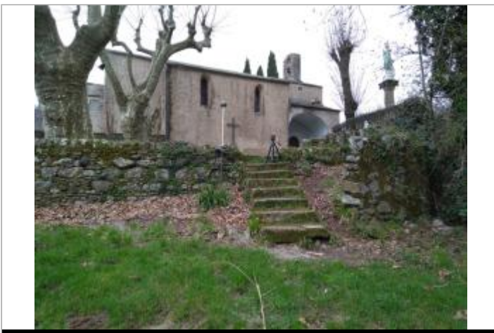
Tas de feuilles mortes

GÉOLOCALISATION Coordonnées WGS84 : X: 3.03901570 / Y: 43.65757170 Coordonnées RGF93 (Lambert 93) X: 703148.1 / Y: 6284281.99 Coordonnées RGF93 (ETRS89) : X: 3.0390157 / Y: 43.6575717 Code Hydro: Y2520500 Rive de référence: Droite