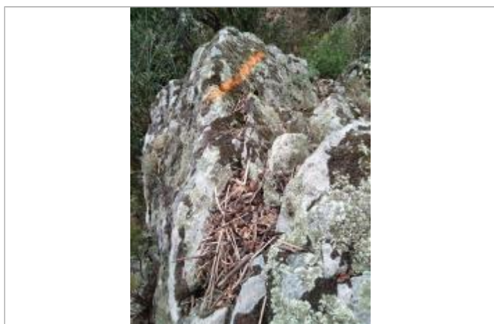
Dépôt sur la roche