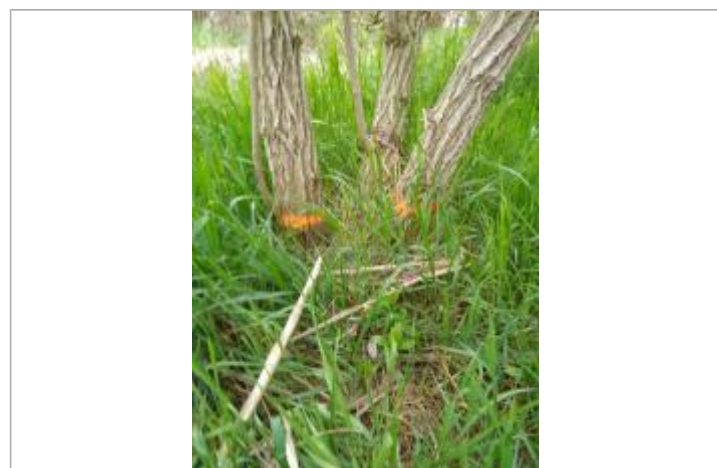
Dépôt contre un sureau

GÉNÉRAL Code : 23_ORB22_R_719_1 Date de mise à jour : 26/04/2023 Auteur : SPC MO