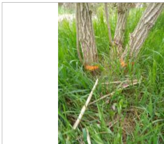
Dépôt contre un sureau