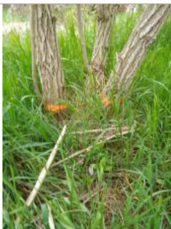
Dépôt contre un sureau