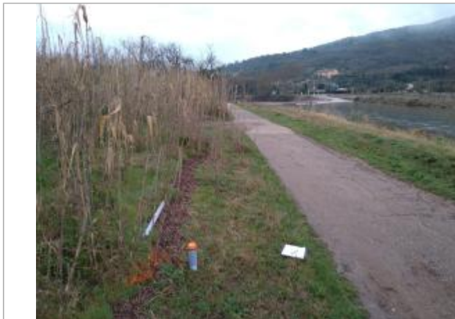
Bord de chemin