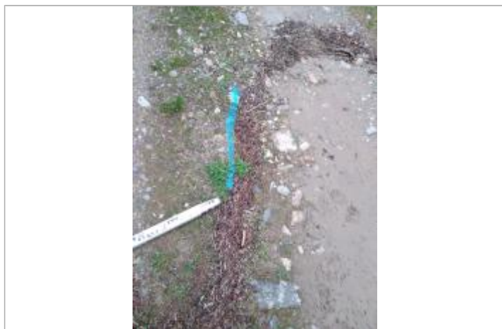
Dépôt sur le chemin

Altitude calculée de l'eau (en m) : 369.763